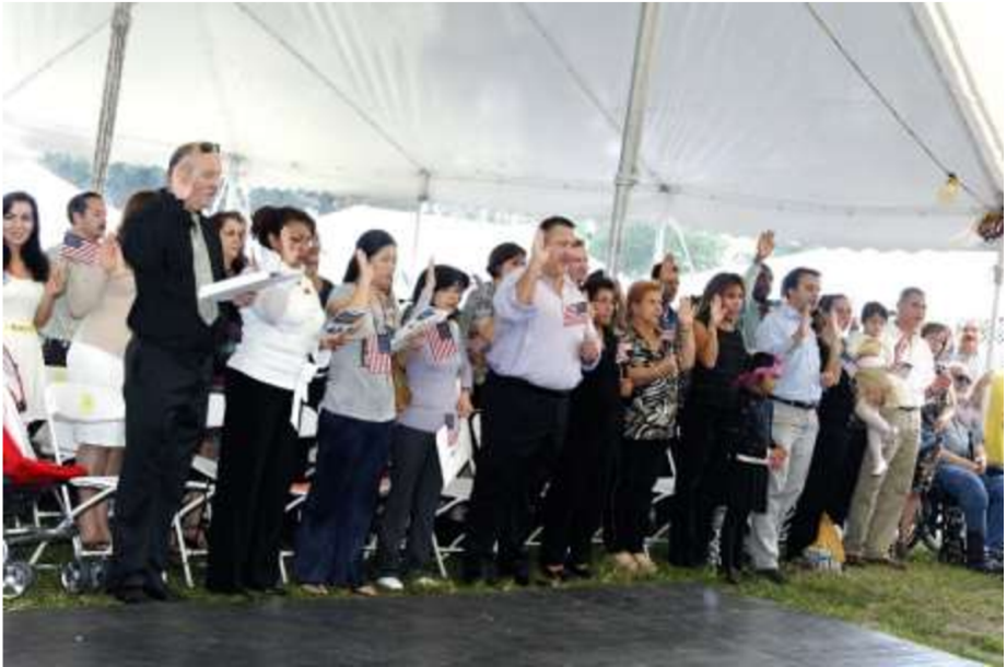
Ceremonia de naturalización en Florida, EEUU, en 2012. Estas personas se han convertido oficialmente en ciudadanos estadounidenses.

EDUCACIÓN PARA LA DEMOCRACIA EN EL SIGLO XXI 9 puedes decidir . Espero que este libro pueda ayudarte a decidir cuáles son tus preferencias políticas y motivarte a asumir tus derechos y responsabilidades como ciudadano de un país democrático.